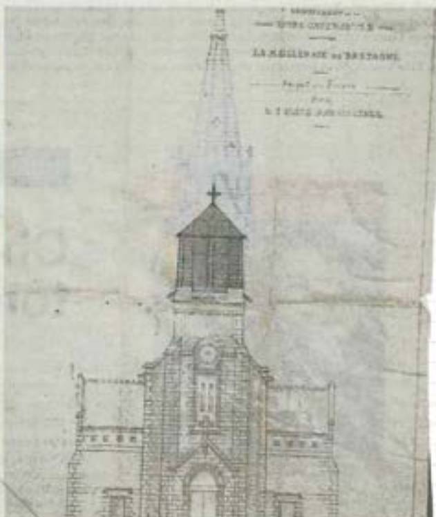
Un des plans d'un projet de la reconstruction du clocher (1902).