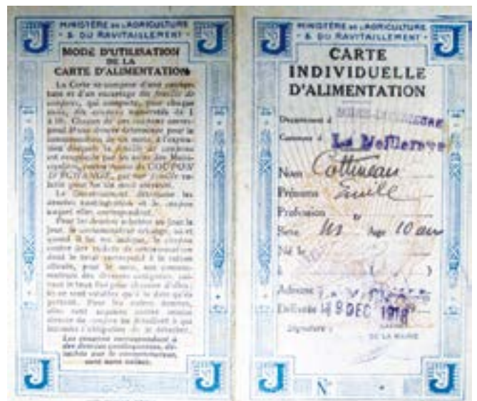
Carte d'alimentation d'Émile Cottineau

Fin 1917, un système de rationnement est imposé par le gou-