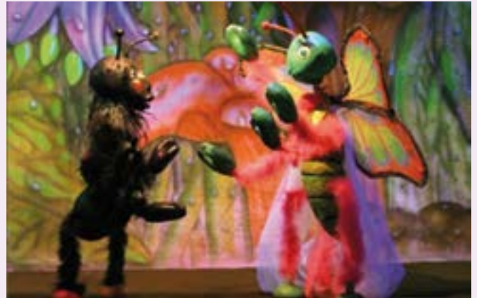
Intervention dans le cadre des TAP présence de près de 100 personnes - enfants et accompagnants

Les TAP (temps d'activité périscolaire) qui étaient en place depuis 3 ans, sont donc abandonnés depuis la rentrée. A la sortie des classes, les enfants sont récupérés par les familles ou accompagnés à l'accueil du périscolaire.