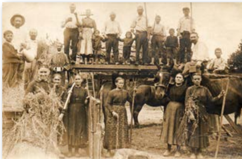
Scène de battage du blé en 1915

Cet article est tiré de l'ouvrage : « 14-18. Les hommes et les femmes du Pays de Châteaubriant ». Une étude longue de 20 pages concerne le maire. En outre, les questions relatives à la construction du monument aux morts de La Meilleraye-de-Bretagne sont présentées dans ce livre.