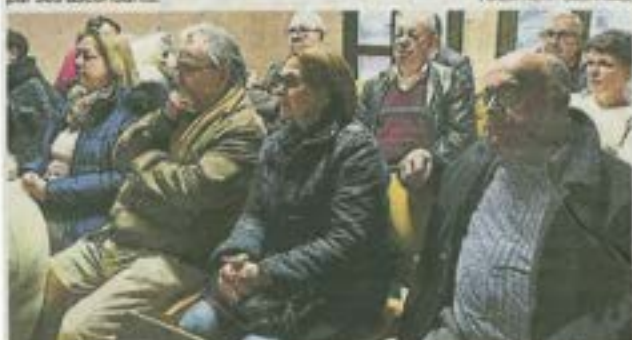
Dimanche dernier, une vingtaine de Meilleriens ont suivi avec grand intérêt la conférence sur les archives de la commune.